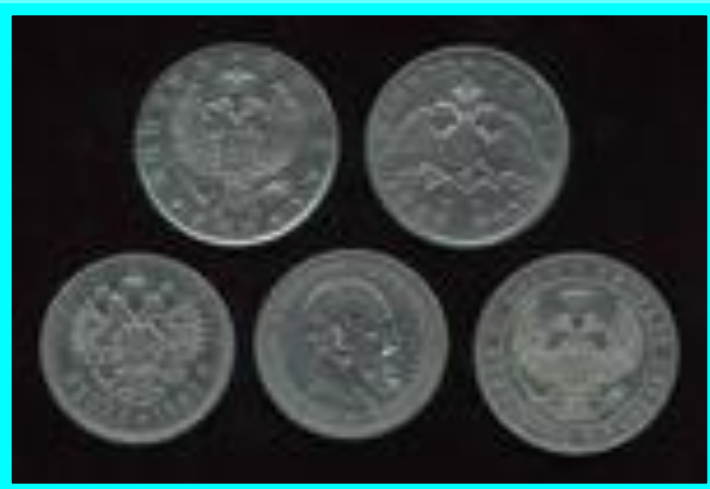
Рубли XVIII века