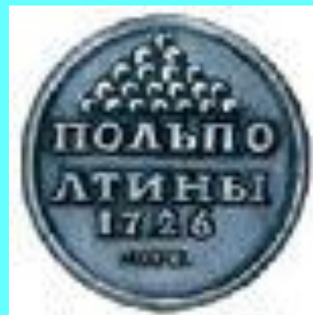
Полполтина 1726 г