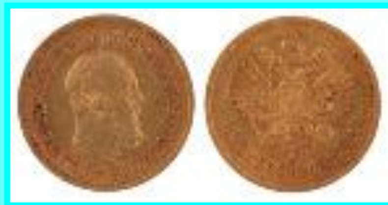
Полтина Петра II