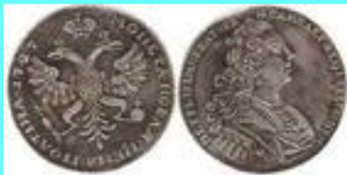
Полтина 1727 г