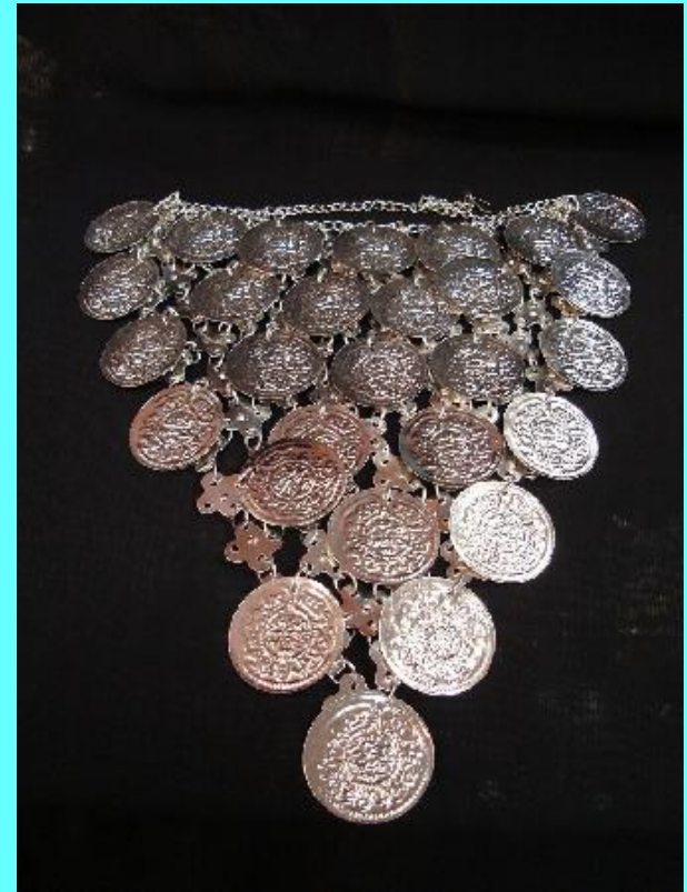
Старинное украшение из монет

Вариант №2. Монета была использована в погребальном ритуале