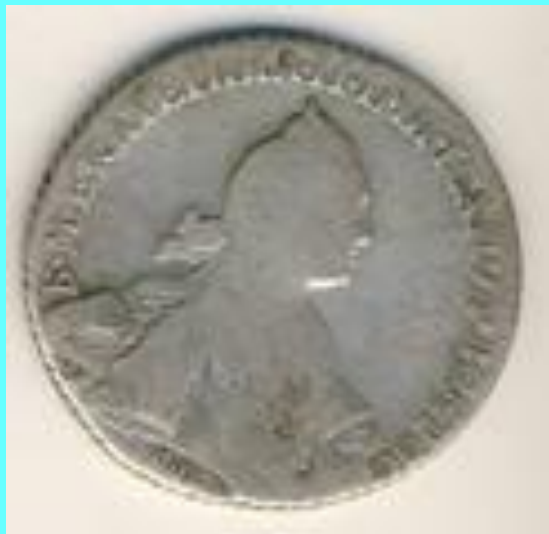
Рубль Екатерины II