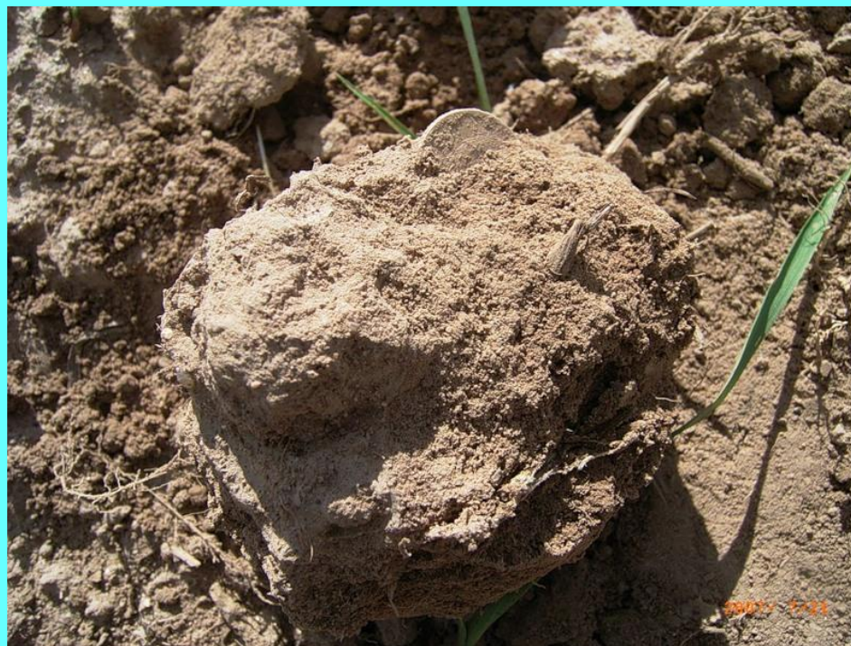
Монета в камне

Вариант №4. Монета была положена в основание дома «на счастье»