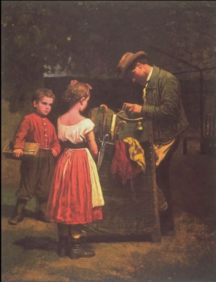
Eastman Johnson. The Scissors Grinder

Промышленная революция сегодня вернула ножницам их первоначальный статус исключительно функционального объекта. Украшения совершенно сошли на нет, от них отказались в пользу прямолинейной чёткости стали. Сегодня созданы ножницы для всех и вся. Они, как и столетия назад, незаменимы. Насколько всё-таки простое гениально!