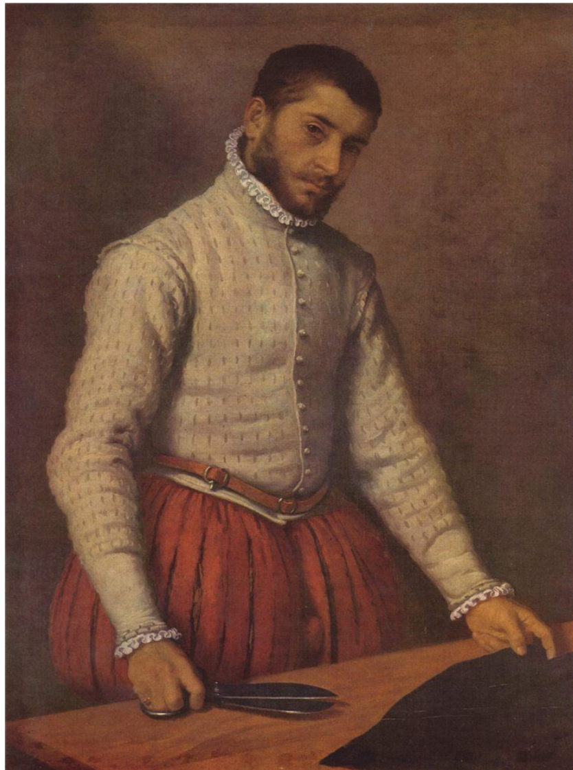
Giovanni Battista Moroni - The Tailor (Il Tagliaranni), Национальная галерея.

Сколько лет ножницам? Как они появились?