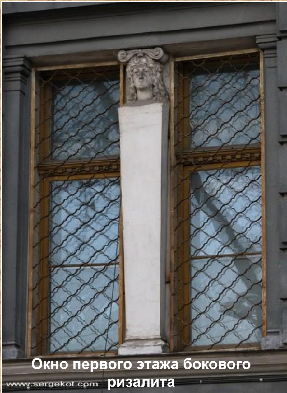
Окно первого этажа бокового ризалита