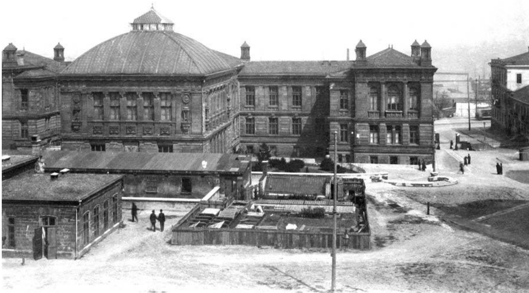
здание в начале XX века