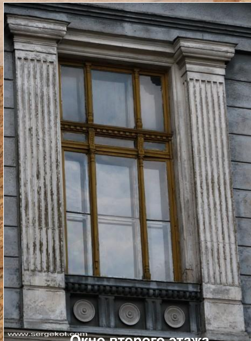
Окно второго этажа