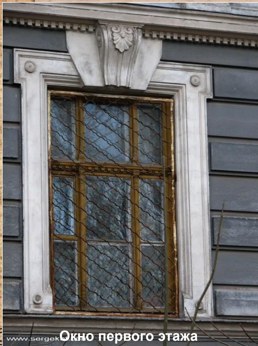
Окно первого этажа