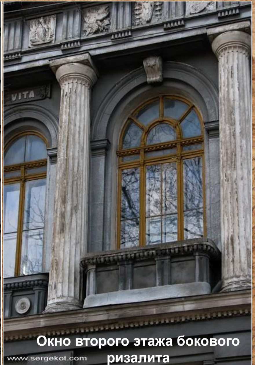
Окно второго этажа бокового ризалита