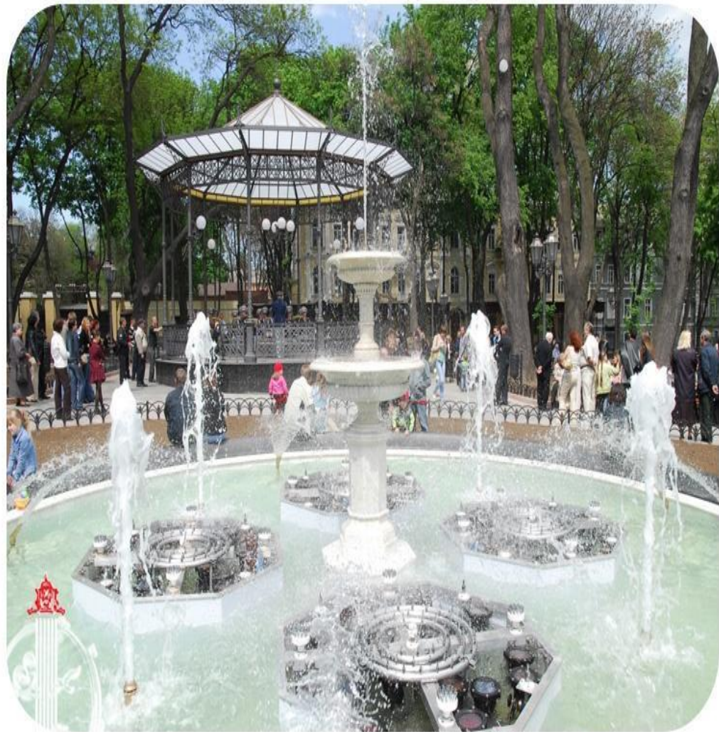
Фонтан в Городском саду Fountain in the City Garden