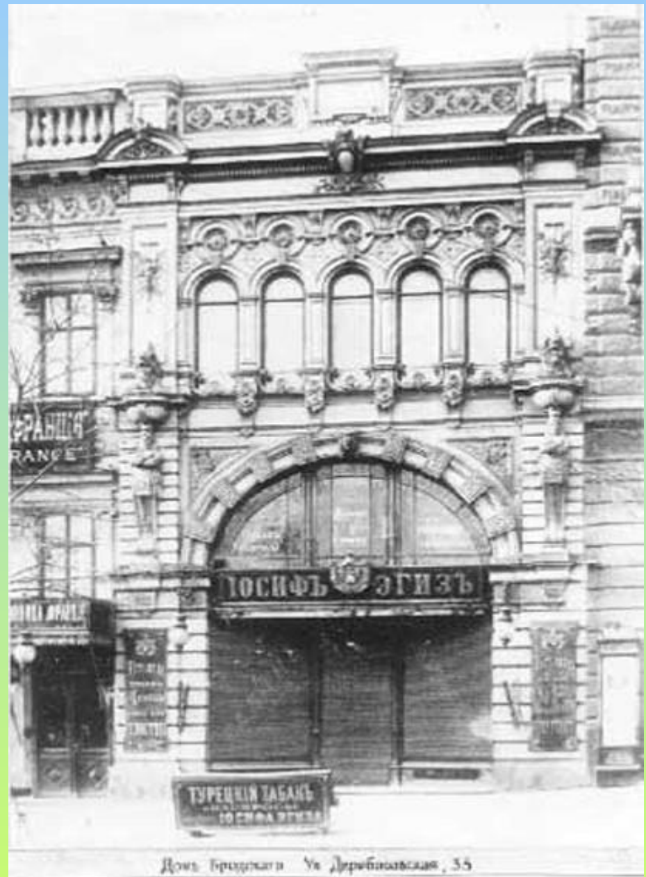
Домъ Гривежана Ул. Дерибасовская, 55

Улица Дерибасовская - любимая улица одесситов, с этой улицей связаны многие незабываемые страницы истории города.