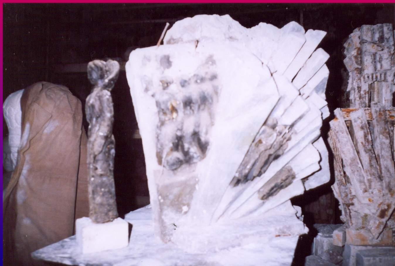
Макет памятника в мастерской скульптора Д.Ф. Горина

По замыслу авторов эту композицию должна была объединять скульптура РОДИНЫ-МАТЕРИ, стоящая перед самым памятником, но в процессе творческого поиска её заменили лавровым венком, который символизирует силу и славу воинства.