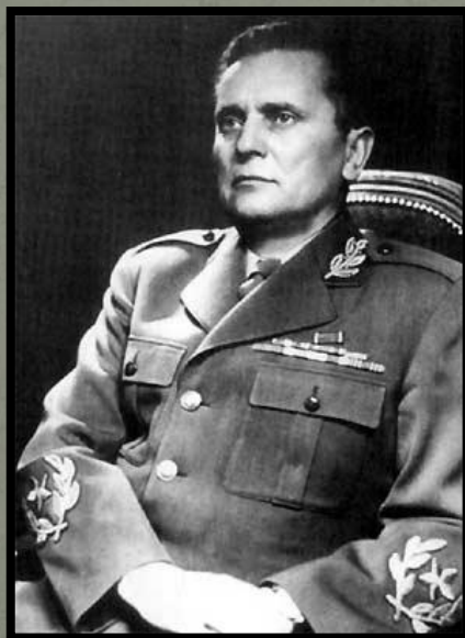
Иосип Броз Тито