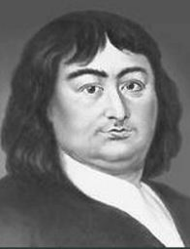
В. И. Беринг