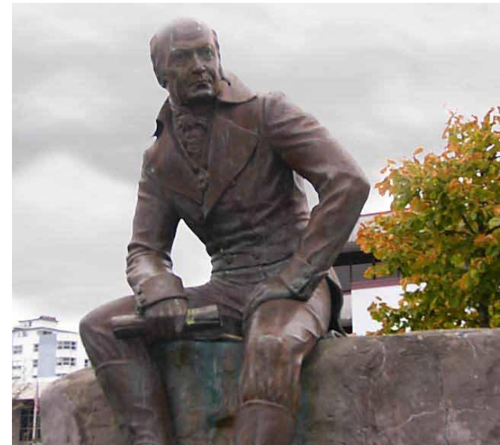
Памятник А.А. Баранову в г. Ситка (Ново-Архангельск) на Аляске

Именно А.А. Баранов в ноябре 1811 г. отправил своего помощника Ивана Андреевича Кускова (1765–1823) на шхуне «Чириков» в Калифорнию для устройства селения, в последствии получившего имя – Форт Росс