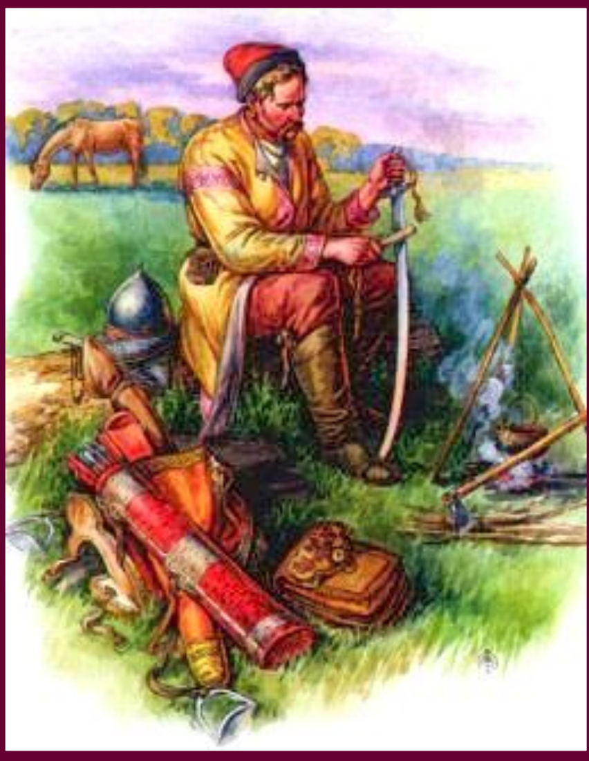
Казак на отдыхе.