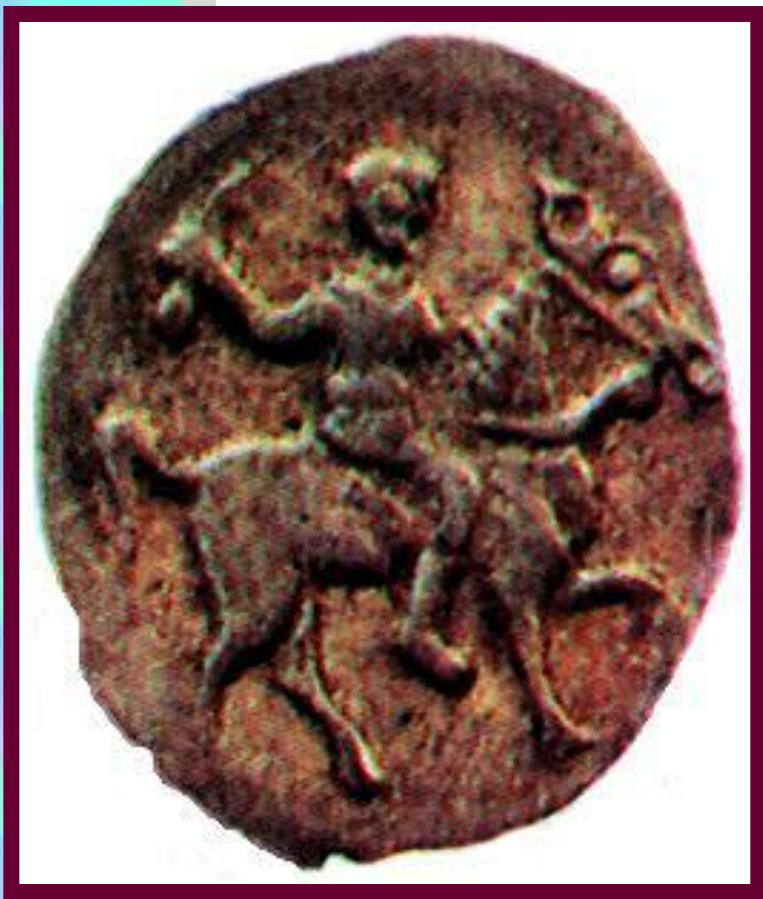
Копейка 1547 г.

Рост объема торговли требовал изменений в системе денежного обращения. В стране не ходило большое количество фальшивых денег и существовало 2 денежных системы-новгородская и московская.