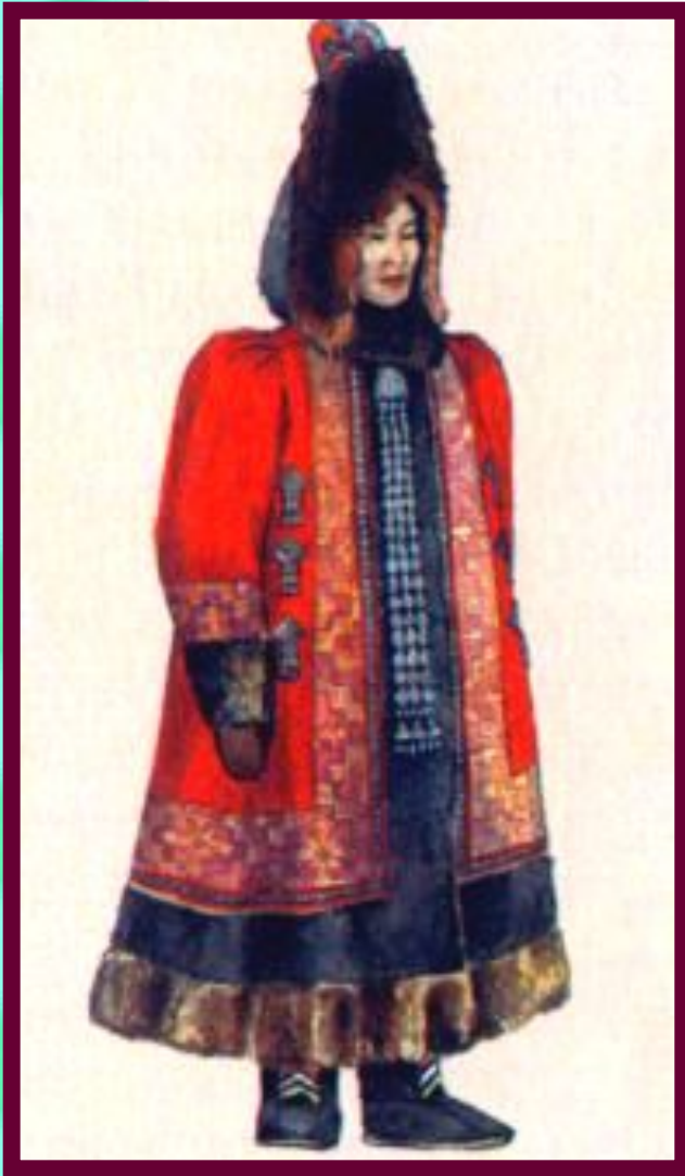
Якутская женщина в зимнем национальном костюме.

У Байкала жили буряты, разводившие крупный рогатый скот и занимавшиеся земледелием. Просо, гречиху и ячмень они обменивали у тунгусов на пушнину. В 17 в. у бурятов зарождается знать.