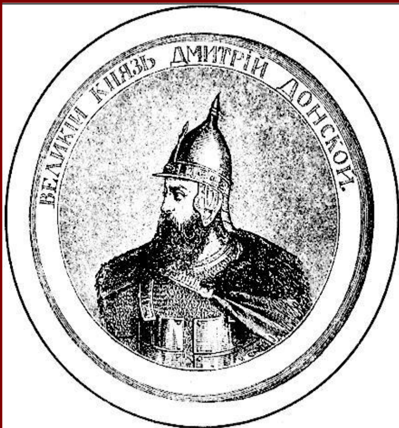
Великий князь Дмитрий. Гравюра XIX в.

В 1375 г. Дмитрий подошел к Твери и тверской князь признал себя «Молодшим братом».