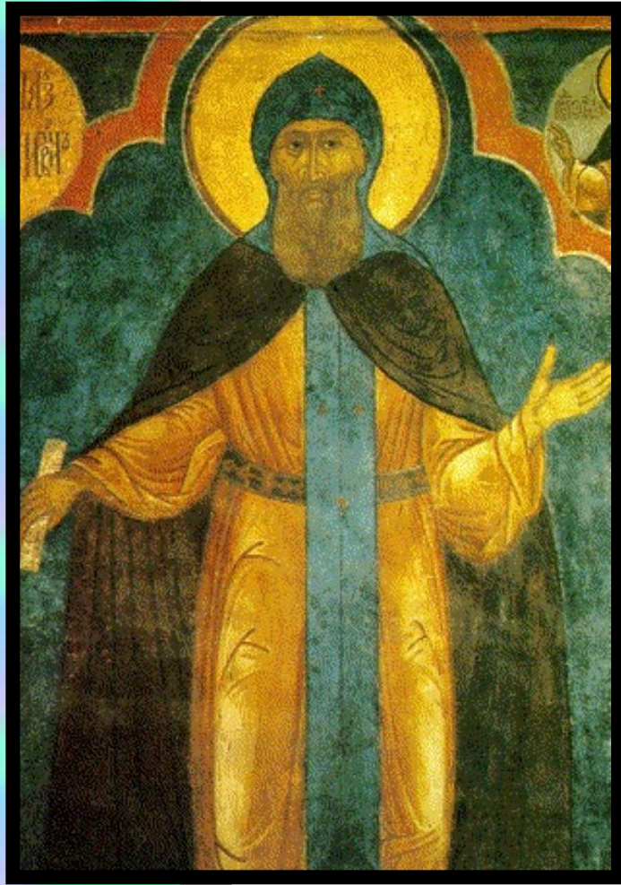
Великий князь Даниил. Фреска Успенского собора Кремля.

Острейшая борьба в н. 14 века развернулась между Москвой и Тве- рью.