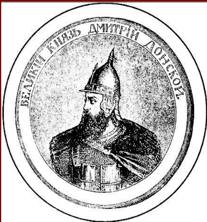
Великий князь Дмитрий. Гравюра XIX в.

В 1375 г. Дмитрий подошел к Твери и тверской князь признал себя «Молодшим братом».