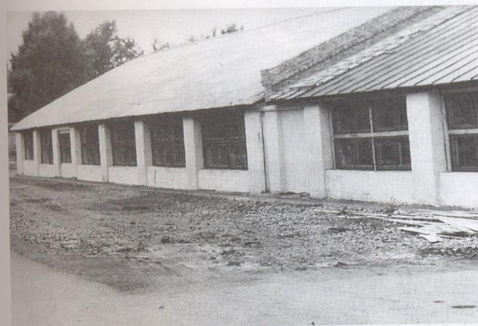
Мастерская № 130.