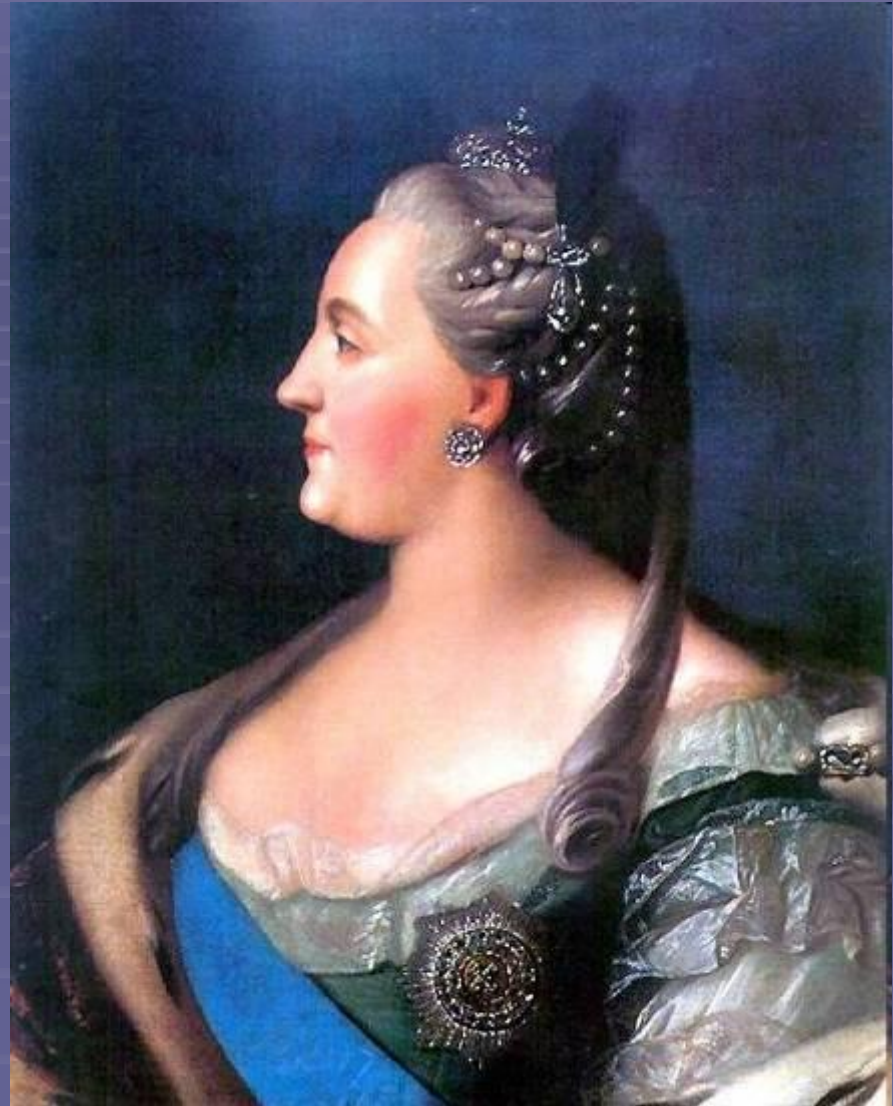
Екатерина Вторая 1762-1796