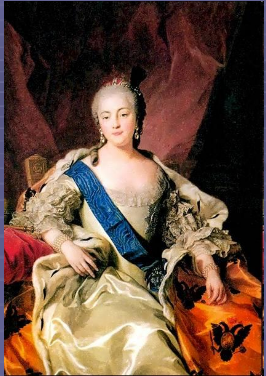
Елизавета Петровна Романова – российская императрица 1741 -1761