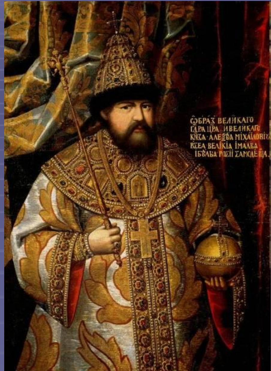
Алексей Михайлович Романов 1645-1676

Закон 1626 г. и «Соборное Уложение» Алексея Михайловича 1649 г. официально запретили процент по ссудам.