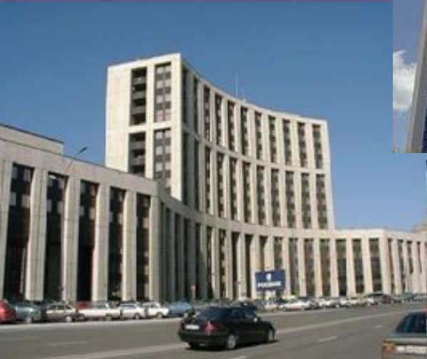
Акционерный коммерческий банк «РОСБАНК»