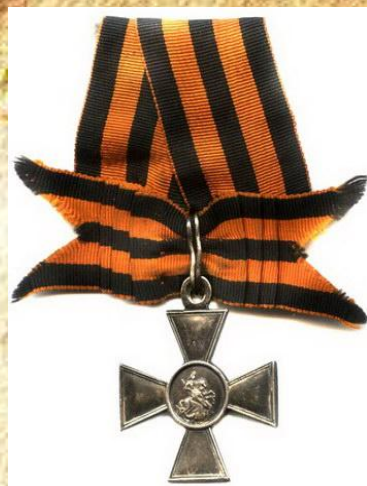
ГК 3 ст. с бантом.

В 1807 году император Александр I учредил специальную награду для нижних чинов Русской Армии за личную храбрость в бою, которая получила название - Знак отличия Военного ордена. Ношение креста предписывалось на ленте, цвета которой соответствовали цветам ордена Св. Георгия. Именно с этого периода популярность Георгиевской ленточки становится всенародной, так как подобные награды простой российский народ видел гораздо чаще, чем золотые ордена офицерского состава Российской Армии. Этот знак в дальнейшем получил название солдатский Георгиевский крест или солдатский Георгий (Егорий), как его называли в народе.