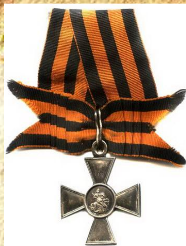
ГК 3 ст. с бантом.

В 1807 году император Александр I учредил специальную награду для нижних чинов Русской Армии за личную храбрость в бою, которая получила название - Знак отличия Военного ордена. Ношение креста предписывалось на ленте, цвета которой соответствовали цветам ордена Св. Георгия. Именно с этого периода популярность Георгиевской ленточки становится всенародной, так как подобные награды простой российский народ видел гораздо чаще, чем золотые ордена офицерского состава Российской Армии. Этот знак в дальнейшем получил название солдатский Георгиевский крест или солдатский Георгий (Егорий), как его называли в народе.