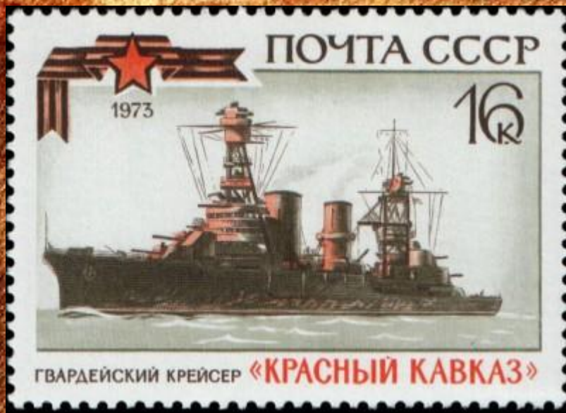
Гвардейская лента на марке почты СССР