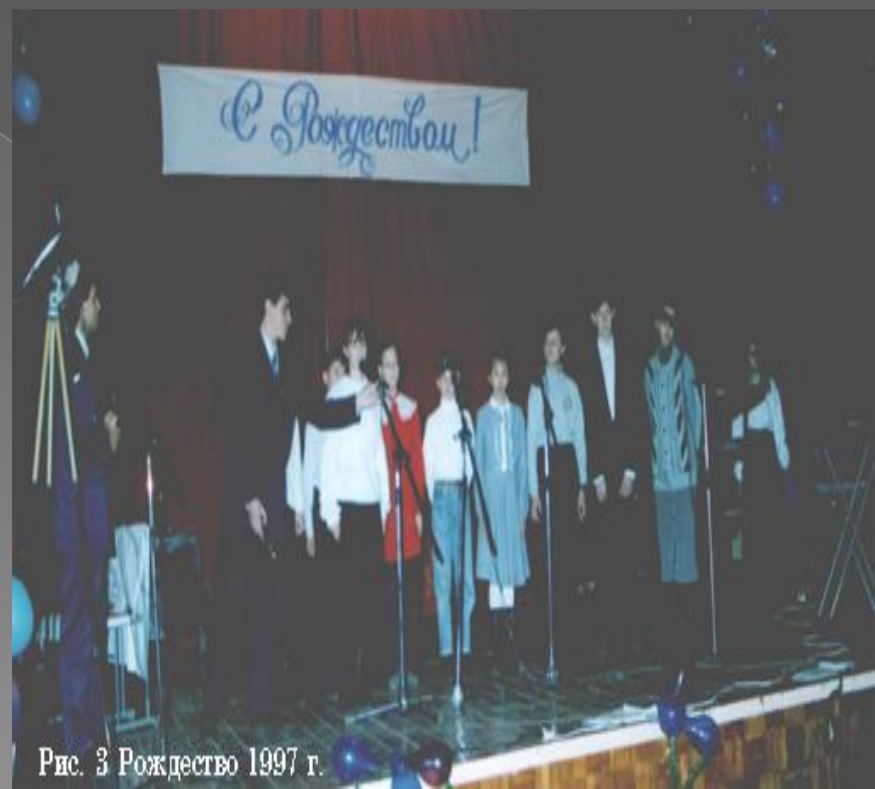
Рис. 3 Рождество 1997 г.