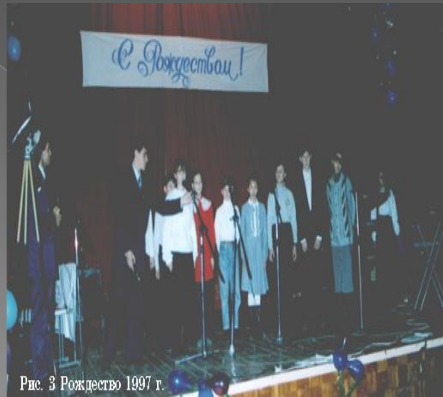
Рис. 3 Рождество 1997 г.