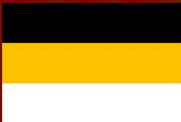
Флаг при Александре II. 1858 г.