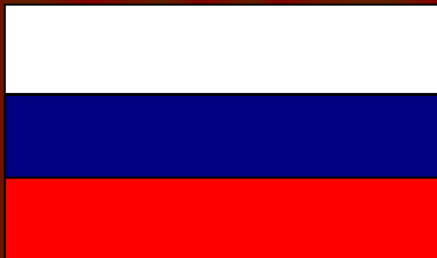
Флаг России с 25.12.00