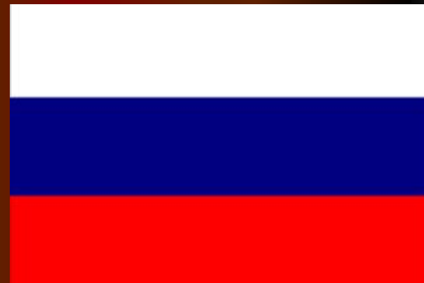
Флаг при Петре I