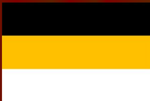
Флаг при Александре II. 1858 г.