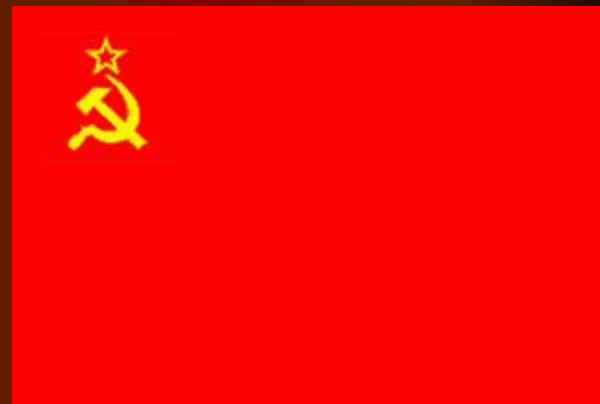
Флаг 1924 г.