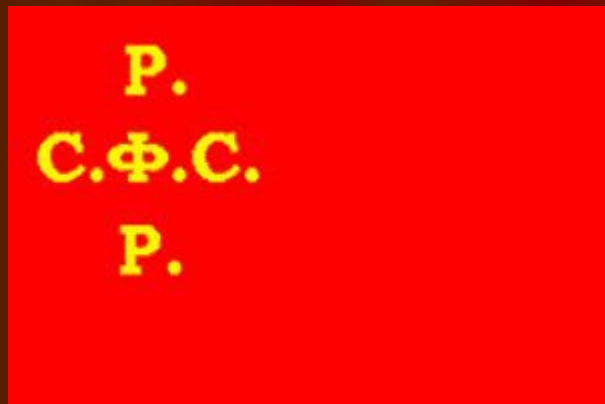
Флаг 1917 года