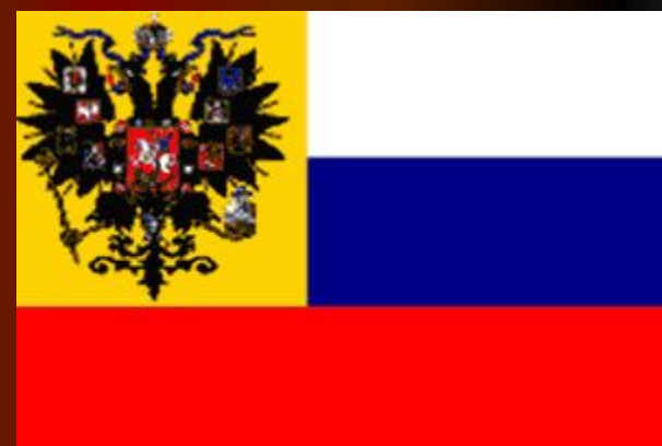
Флаг при Александре III. 1883 г.

Первое изображение флага Дмитрия Донского