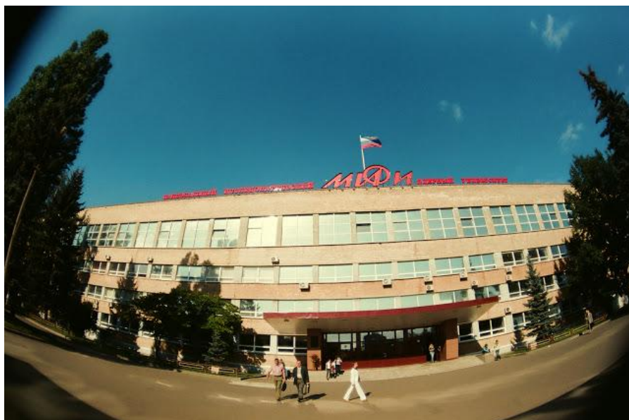
5 место Национальный исследовательский ядерный университет «МИФИ»