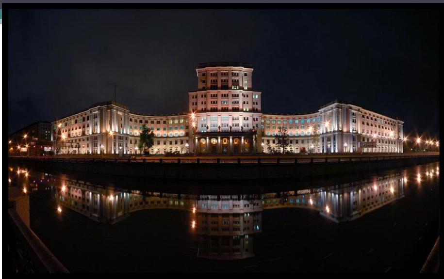
3 место МГУ им. Н. Э. Баумана.