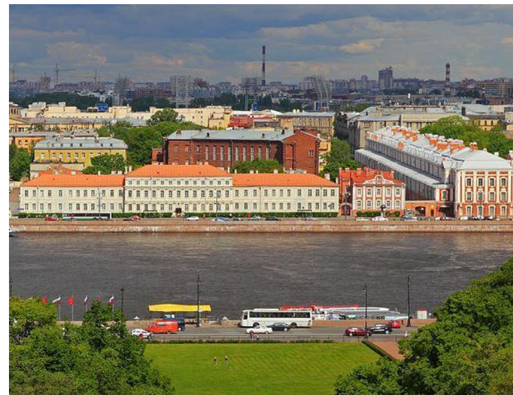
4 место СПбГУ.