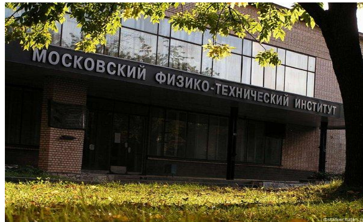
2 место МФТИ.