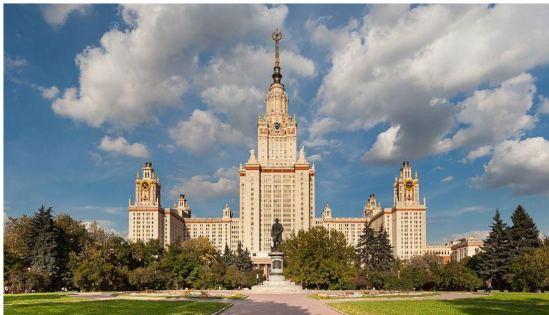
1 место МГУ им. М. В. Ломоносова.