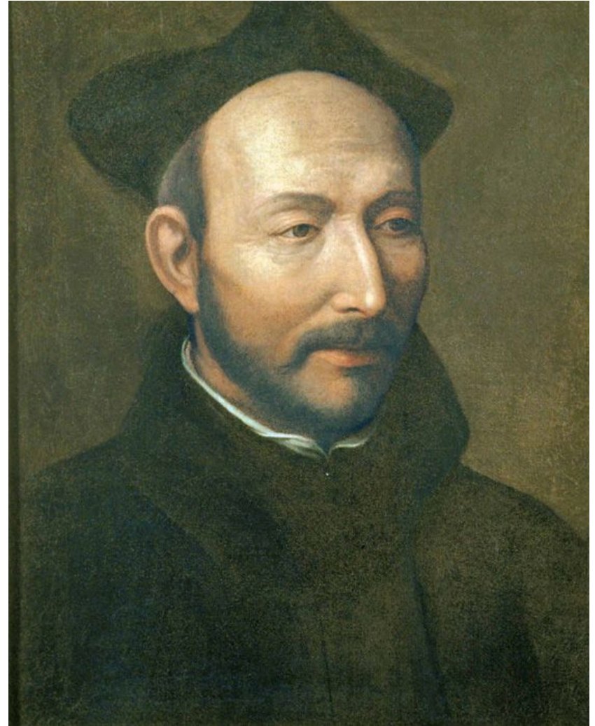
Игнатий Лойола – основатель Ордена