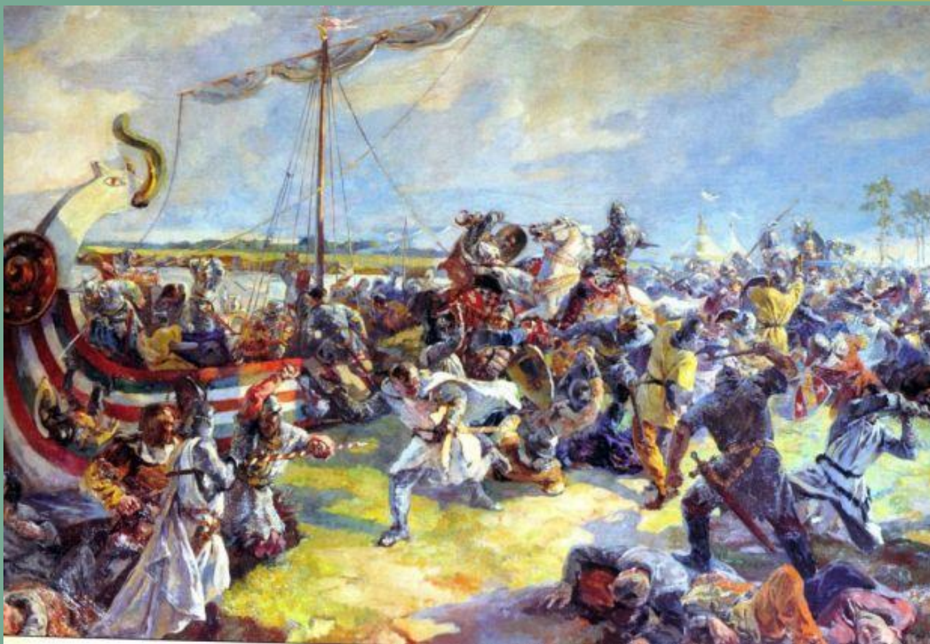
■ Битва на Неве