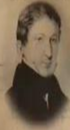
МАТВЕЙ МУРАВЬЁВ- АПОСТОЛ