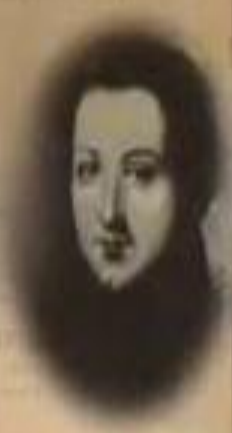
МИХАИЛ БЕСТУЖЕВ- РЮМИН