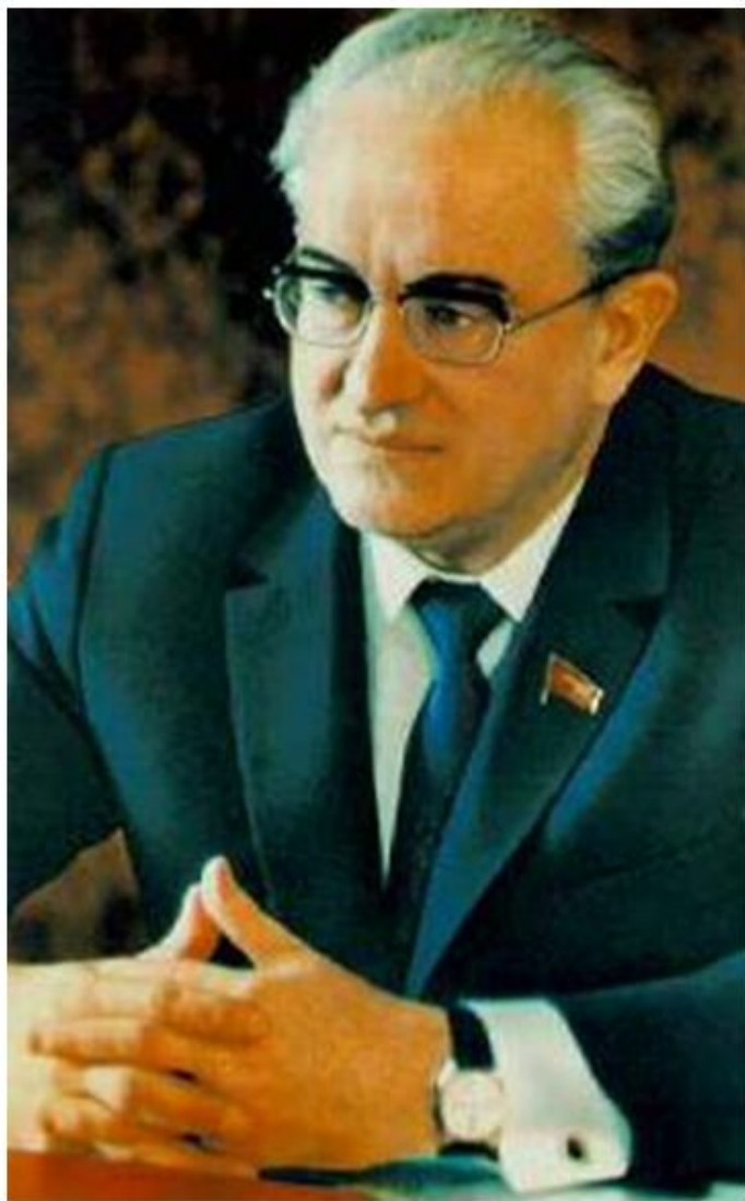
Ю. В. Андропов.

В ноябре 1982 г. во главе страны встал Ю. Андропов. Он был образован, бескорыстен, аскетичен, умел располагать людей к себе. В то же время он был типичным представителем партийной номенклатуры. Возглавляя в течение 15 лет КГБ он, как никто другой имел реальное представление о положении дел в стране. Ю. Андропов сделал ставку на «молодежь». При нем резко возвысился М. Горбачев, появились в высшем руководстве страны Е. Лигачев и Н. Рыжков.