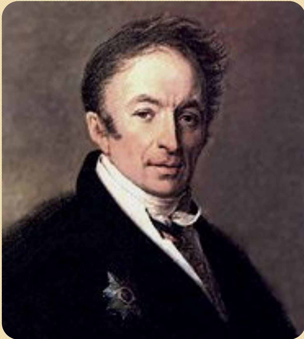
Н. М. Карамзин. Портрет работы А. Г. Венецианова. 1828 г.