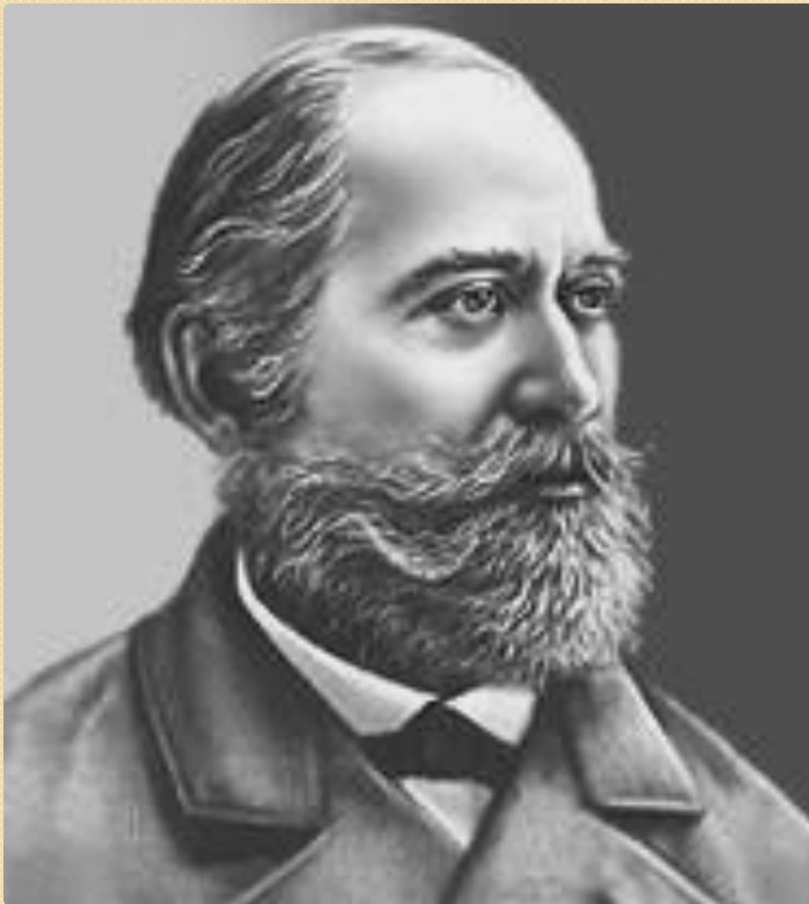
СОЛОВЬЕВ Сергей Михайлович