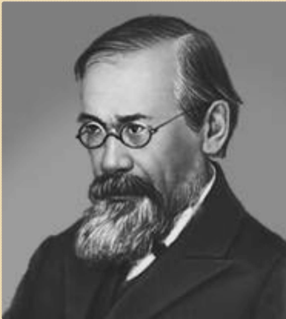
КЛЮЧЕВСКИЙ Василий Осипович