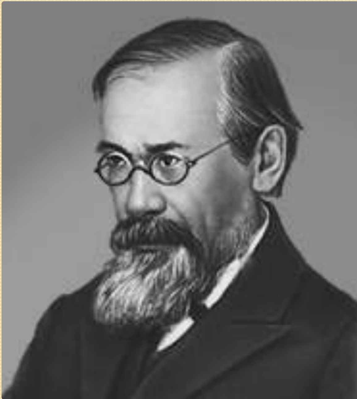
КЛЮЧЕВСКИЙ Василий Осипович