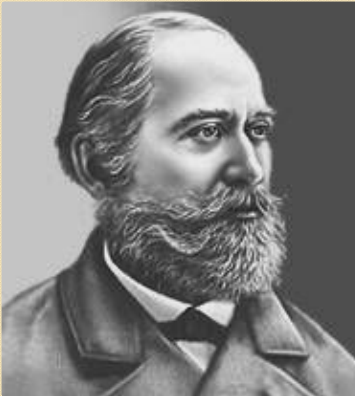
СОЛОВЬЕВ Сергей Михайлович