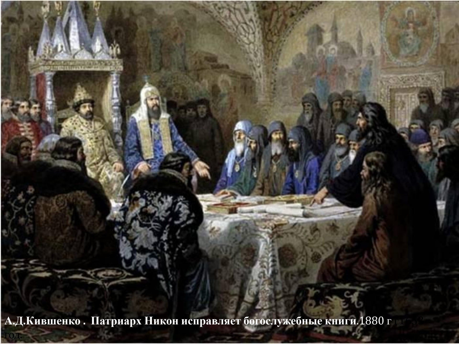
А.Д.Кившенко . Патриарх Никон исправляет богослужebные книги.1880 г 11632 год.