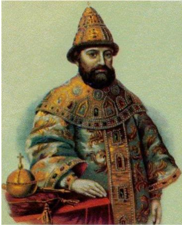
Михаил Федорович Романов