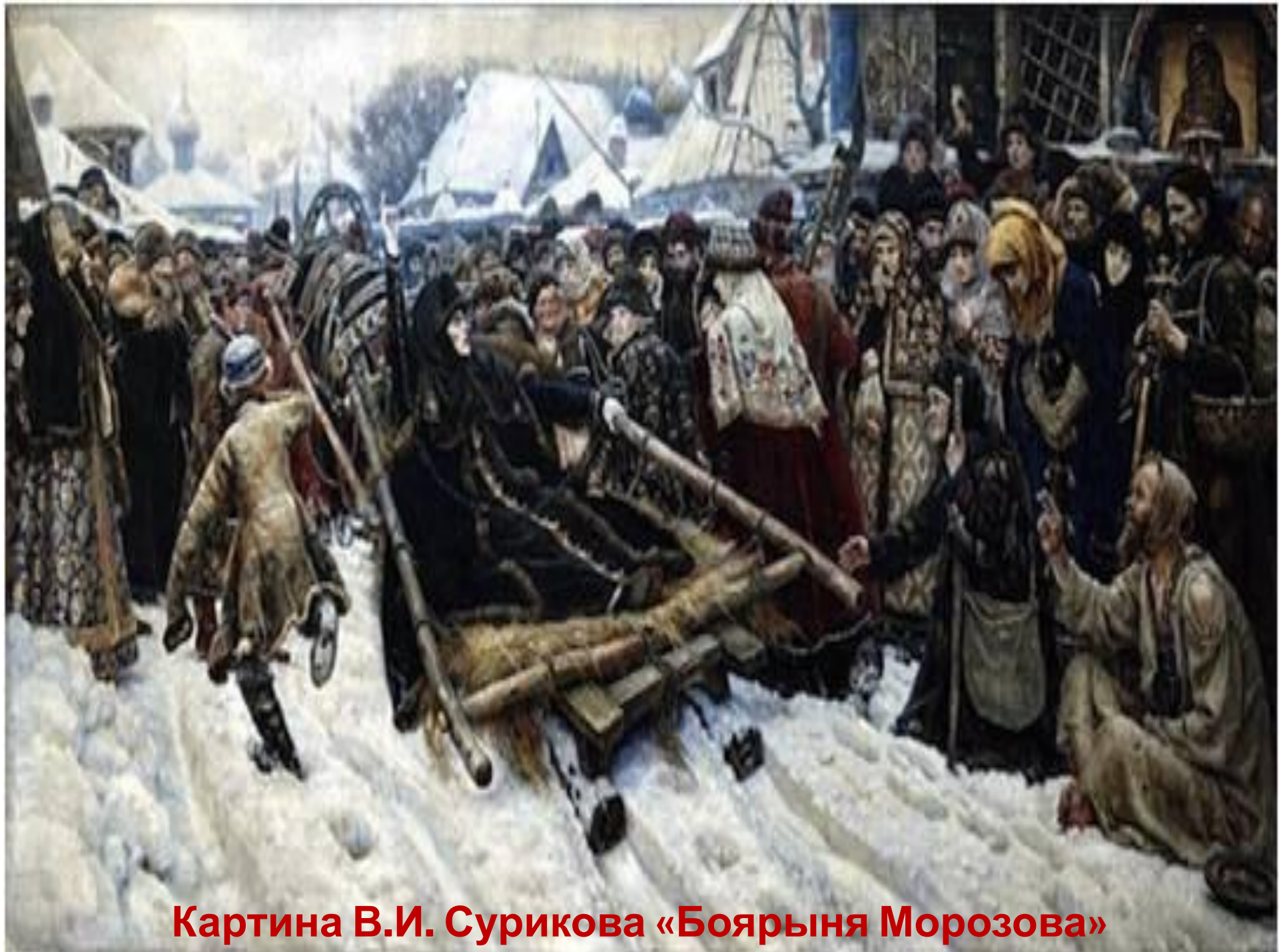
Картина В.И. Сурикова «Боярыня Морозова»