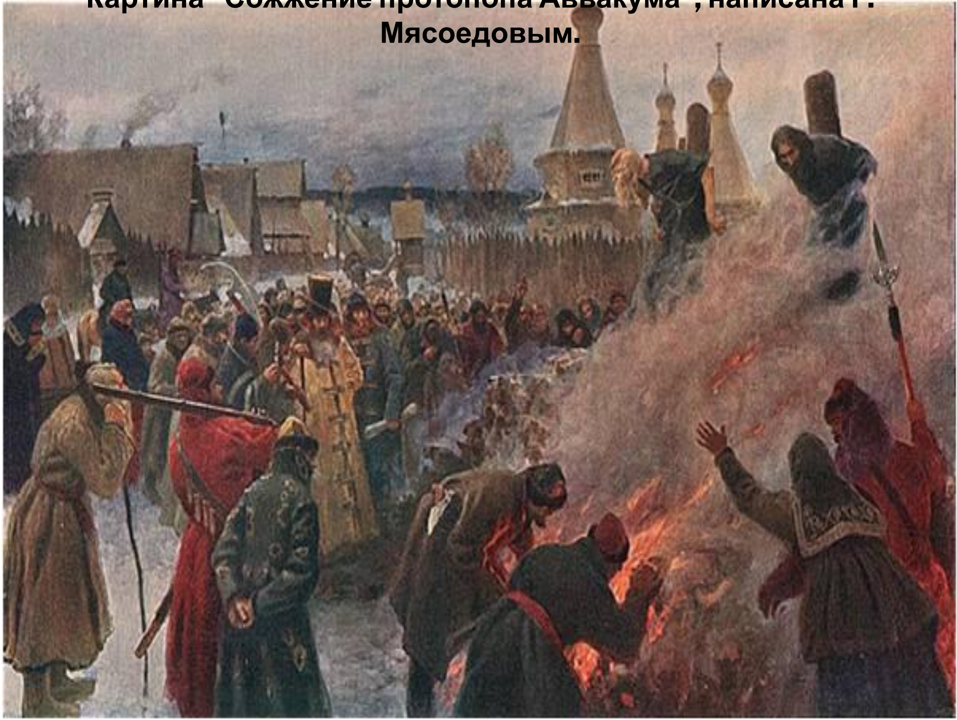
Картина «Сожжение протопопа Аввакума», написана Г. Мясоедовым.