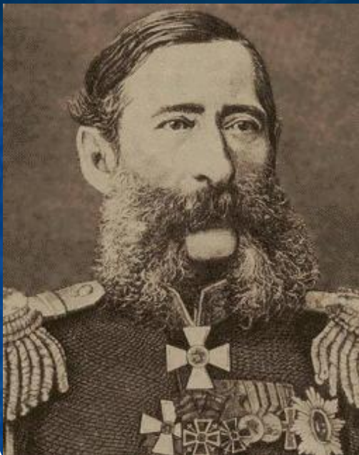
М. Г. Лорис-меликов (1825-1888)

Начальник Верховной распорядительной комиссии при МВД