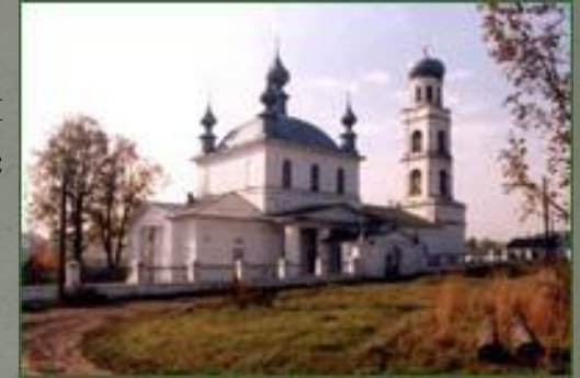
Рис.4. г.Шуя Преображенский собор