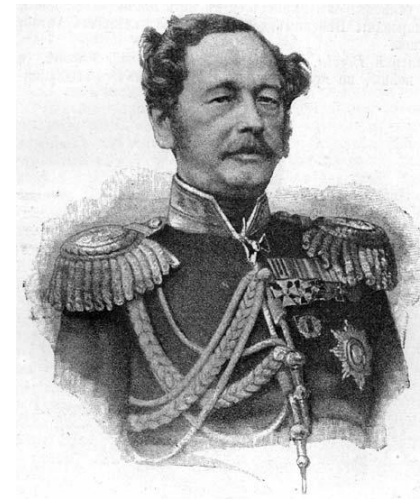
Рис. 8. Н. Н. Муравьев-Амурский (1809- 1881)