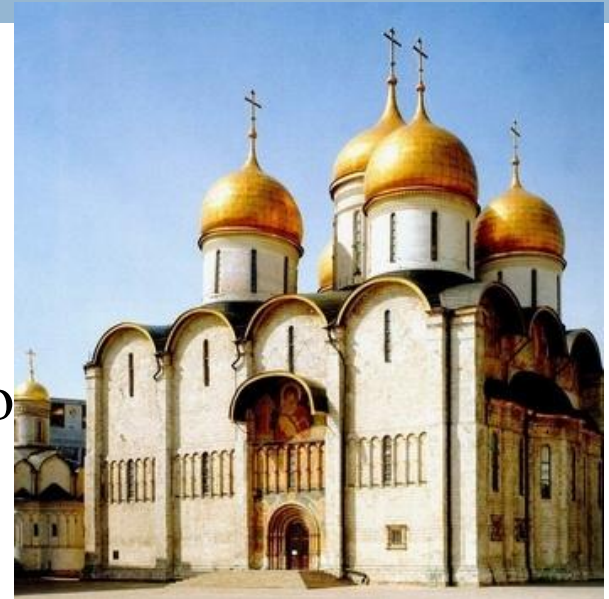
Рис.6. Успенский собор, г. Москва