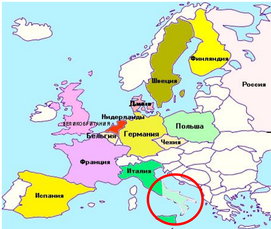
Рис.1. Начало формирования фамилий на севере Италии (X век)