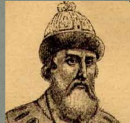
Рис.5. Князь Шуйский Василий Иванович