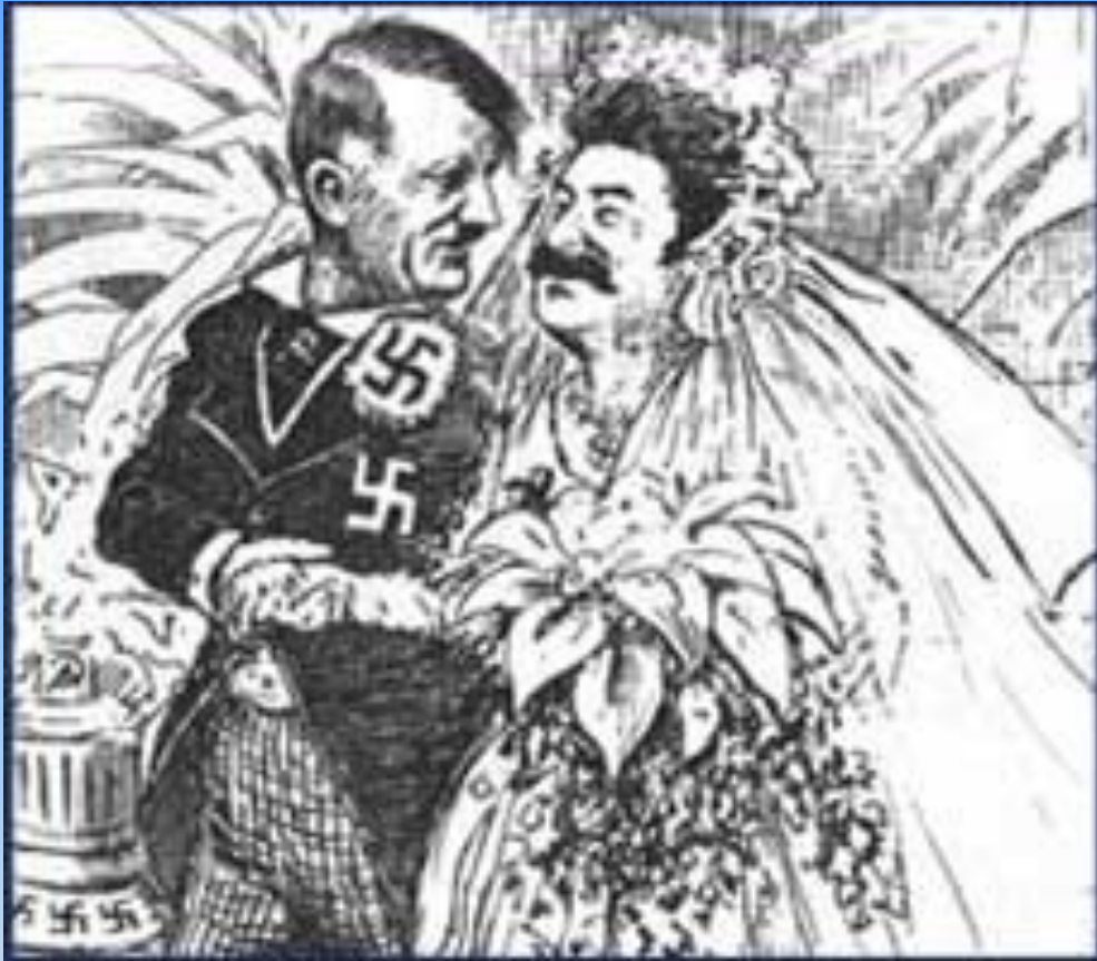
карикатура американца Клиффорда Берримана

1. Какие события отражены в данной карикатуре?