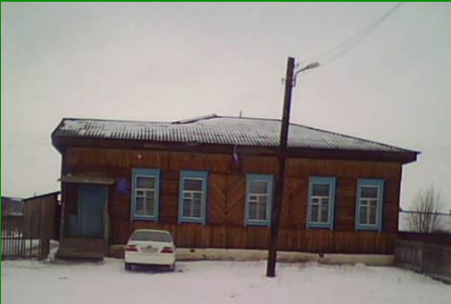
Здание Межовской сельской администрации