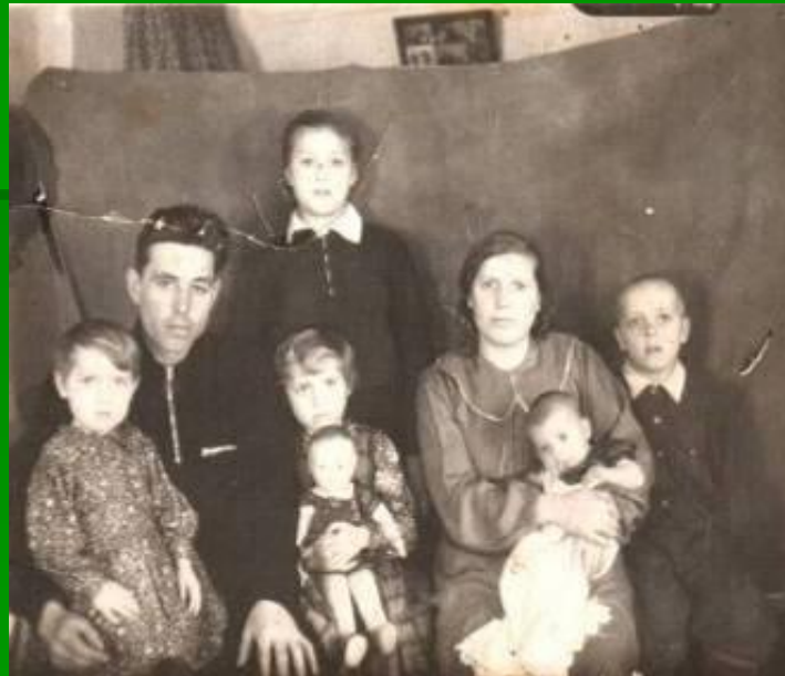
Семья Лейком – переселенцев с Поволжья

Немецкая диаспора на селе насчитывала 100 человек.