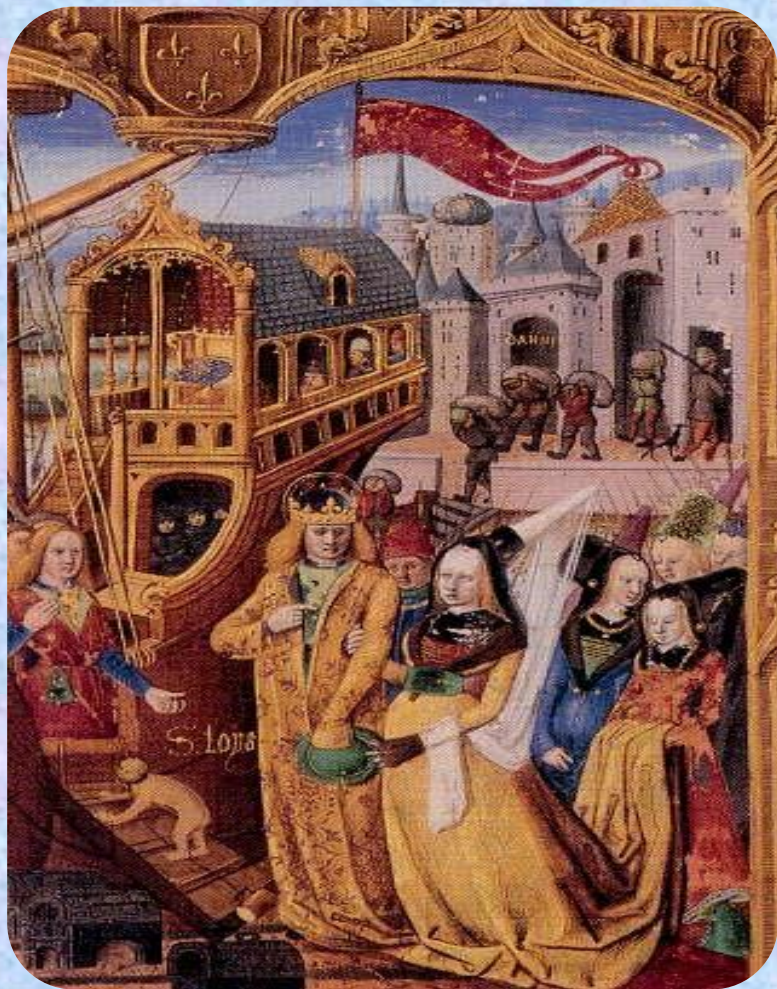
Людовик Святой с женой