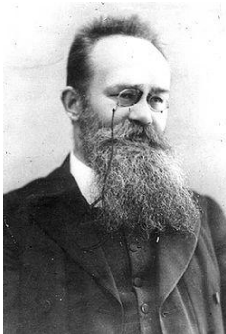
Грушевский М. С. (1866 - 1934) Научные интересы: Историческая методология, история Украины