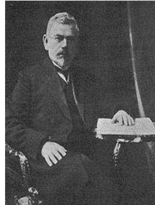
Багалей Д. И. (1857 - 1932) Научные интересы: История Слободской Украины