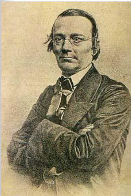
Костомаров Н. И. (1817 - 1885) Научные интересы: История Украины в XVII в., Историческая биографистика