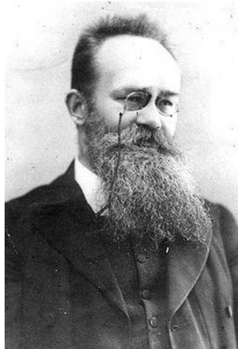
Грушевский М. С. (1866 - 1934) Научные интересы: Историческая методология, история Украины