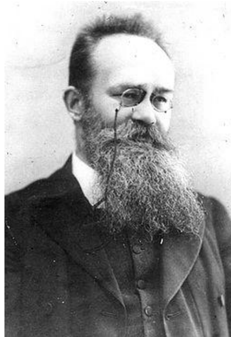
Грушевский М. С. (1866 - 1934) Научные интересы: Историческая методология, история Украины