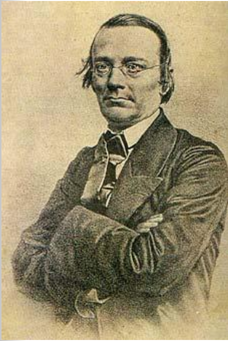
Костомаров Н. И. (1817 - 1885) Научные интересы: История Украины в XVII в., Историческая биографистика