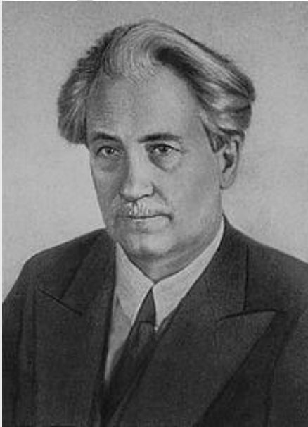
Греков Б. Д. (1882 - 1953) Научные интересы: История Киевской Руси