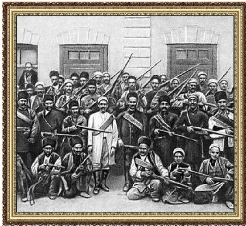
Революционный отряд на улицах Тегерана

Нач. XX века – подъем НОД в Азии. Революции: Иран (1905-1911), - Турция (1908), Китай (1911-13), + Россия , Мексика .