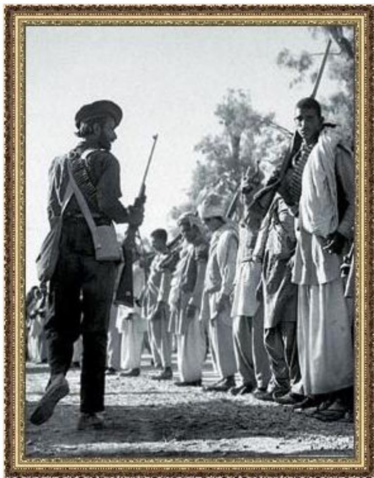
Индусы в колониальной армии

Причины революций — неуспех предшествовавших реформ.