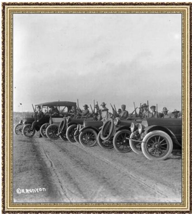
Мексиканские повстанцы на трофейных автомобилях

Поддержка США. Ген. Каранса против + крестьянская армия (Э. Сапата). США интервенцию.