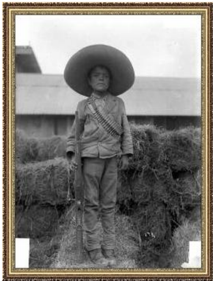
Мексиканский мальчик-солдат Освободительной армии

Борьба за Конституцию и буржуазные свободы. Партизанские отряды.