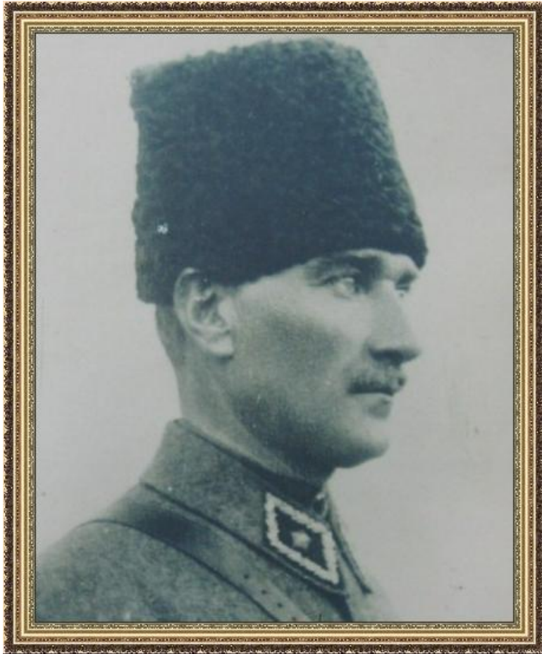
Мустафа Кемаль. Лидер младотурецкой революции

Иран – революция 1905-1911 гг. «Справедливость!». 1906 г. – Конституционный строй и менджлис, политические организации и СМИ. Противостояние Шах – Менджлис – вмешательство России и Англии – подавление революции. Сферы влияния.