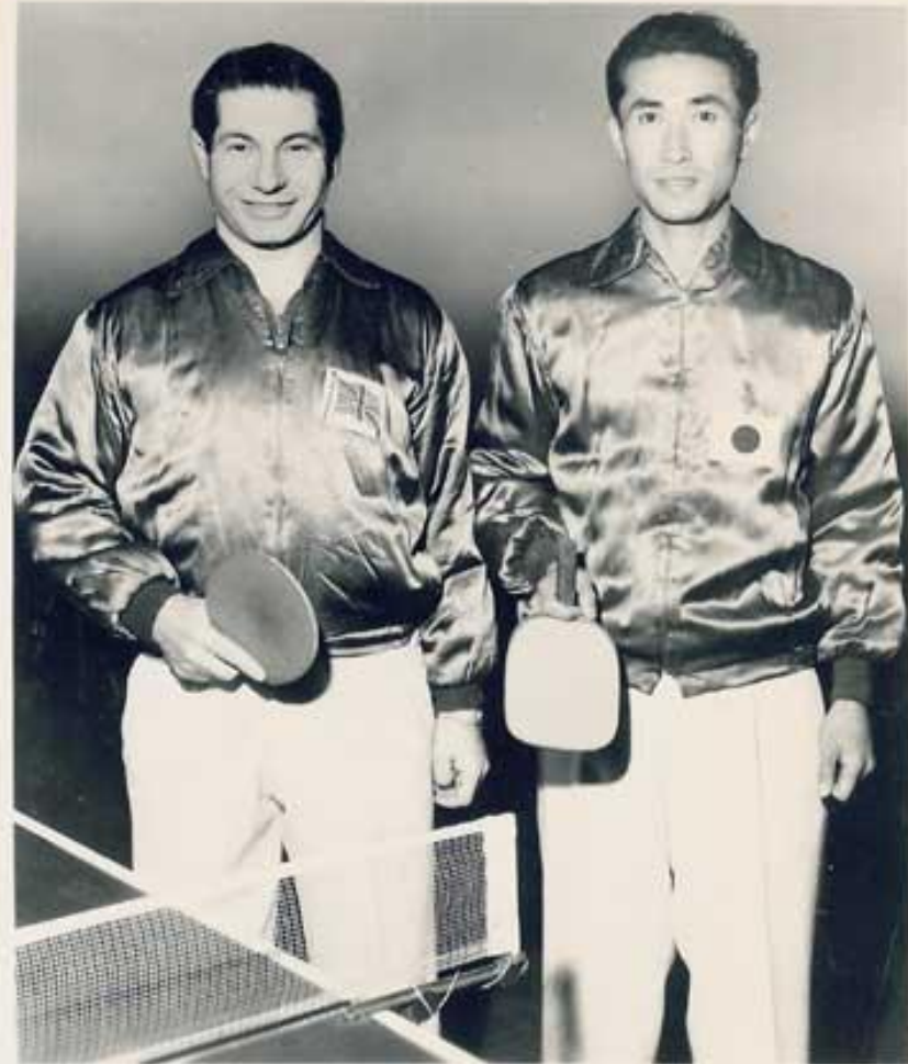
WORLD TABLE TENNIS CHAMPIONS