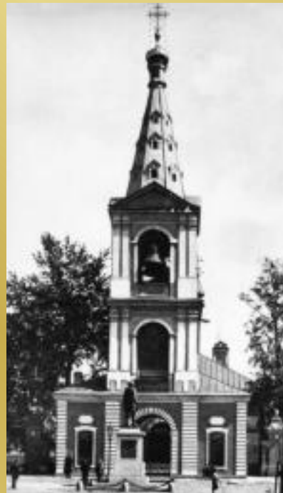
Церковь Сампсона Странноприимца