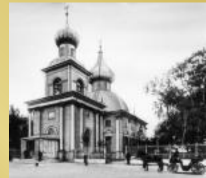
Собор Пресвятой Троицы