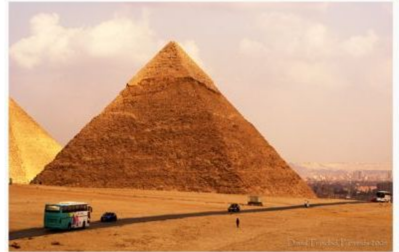
Пирамида Хеопса, Египет