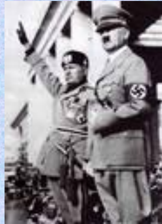
Б. Муссолини и Адольф Гитлер