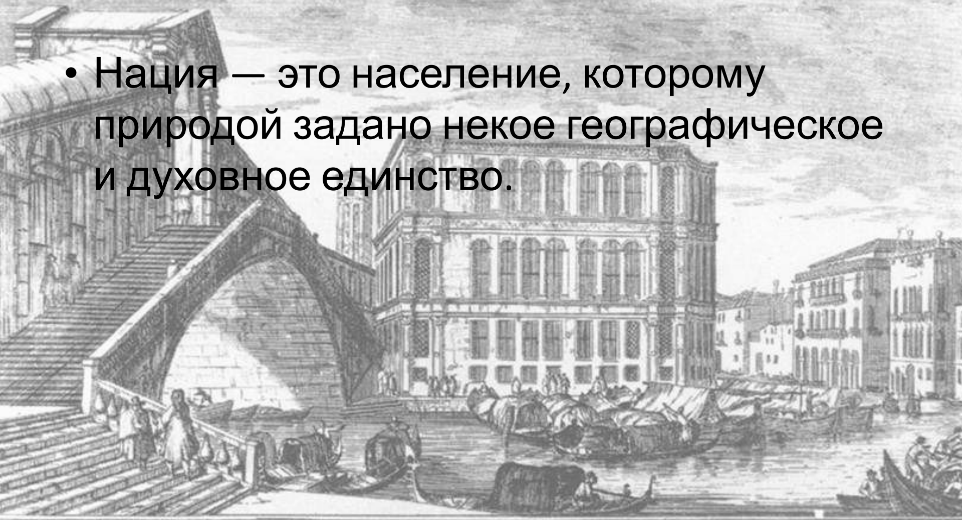
ALTRA VEDUTA DEL PONTE DI RIALTO