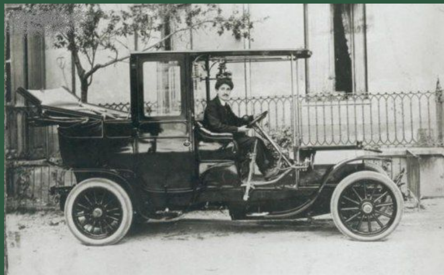
Автомобильная фирма «Фиат»