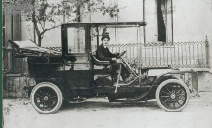
Автомобильная фирма «Фиат»