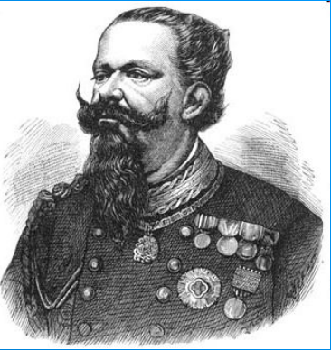
Виктор Эммануил II