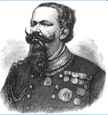
Виктор Эммануил II