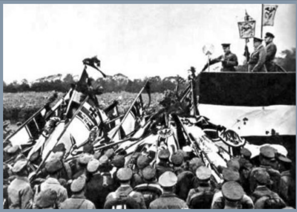
Фашизм в Италии