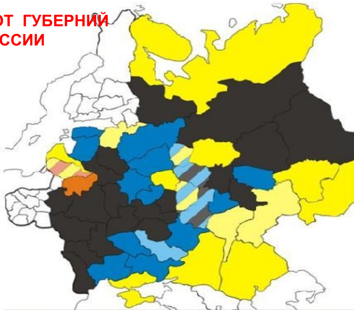
Члены IV Думы от губерний Европейской России.