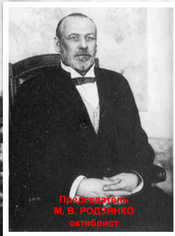
Председатель М. В. РОДЗЯНКО октябрист