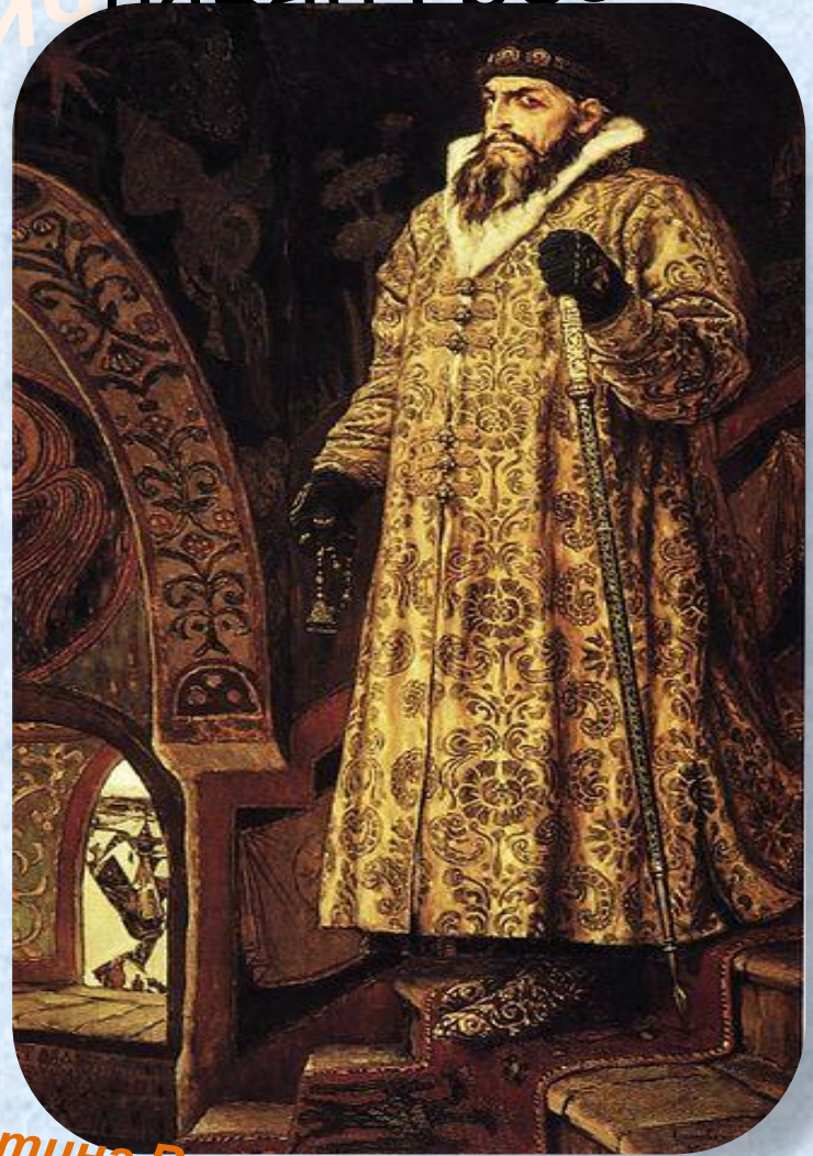
Картина Виктора Васнецова