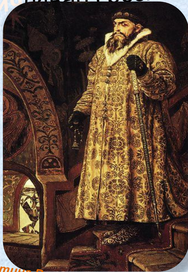
Картина Виктора Васнецова