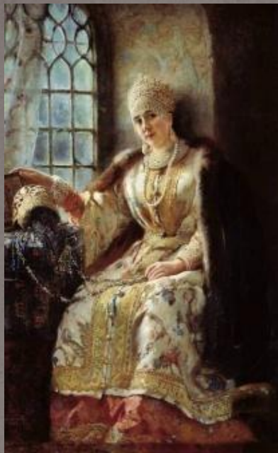
Анастасия Романова, первая жена