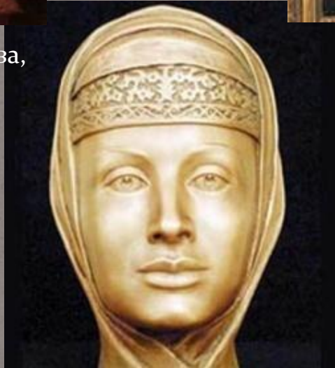
Марфа Собакина, третья жена.