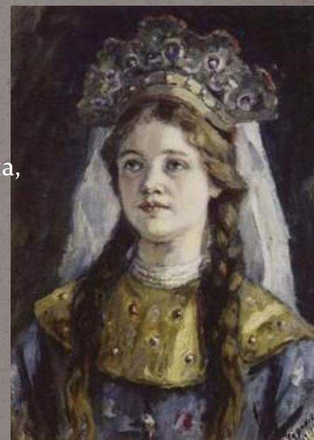
анна колтовская четвертая жена ивана грозного