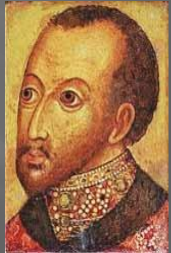
Царь Федор Иванович