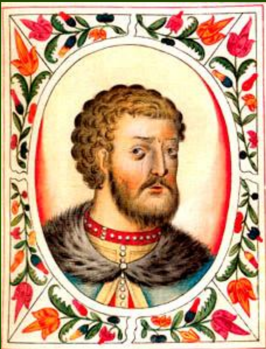
Великий князь владимирский и московский Иоанн II Иоаннович Красный

Прозвище «Красный» получил, по всей видимости, благодаря исключительной внешности (красный – красивый). В летописях встречаются и иные прозвания этого князя – «Милостивый», «Кроткий».