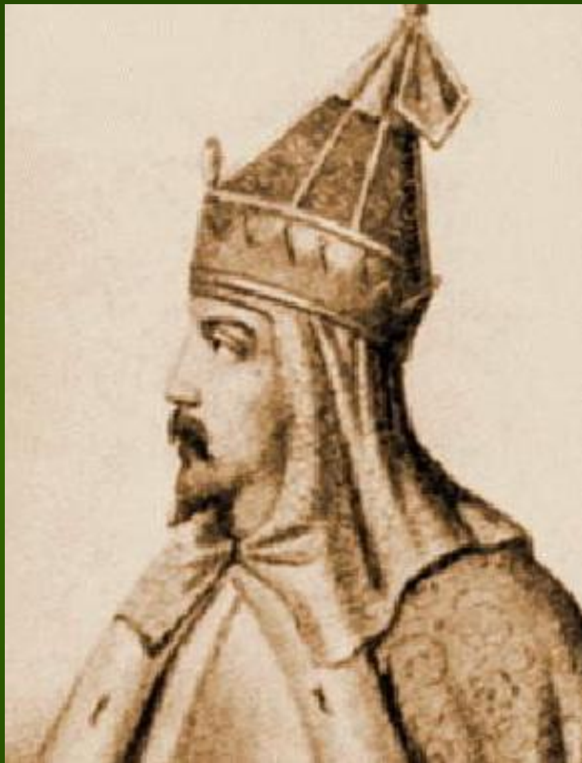
Иван II Красный