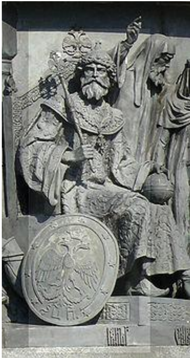
Иван III на Памятнике «1000-летие России» в Великом Новгороде.