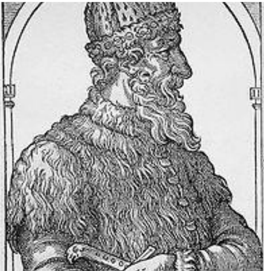
Иван III Васильевич. Гравюра из «Космографии» А. Теве, 1575 год