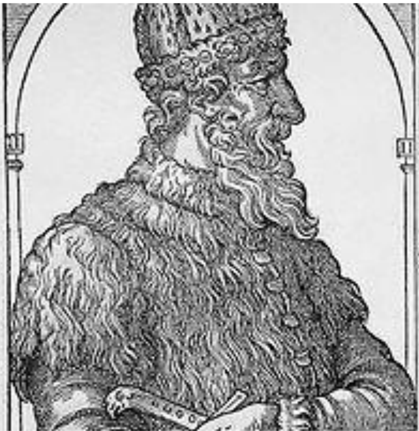
Иван III Васильевич. Гравюра из «Космографии» А. Теве, 1575 год